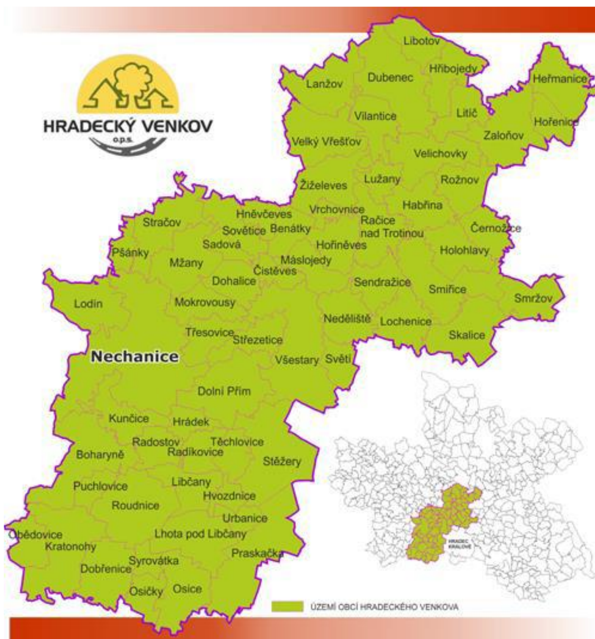
Obrázek 1 Mapa území MAS Hradecký venkov